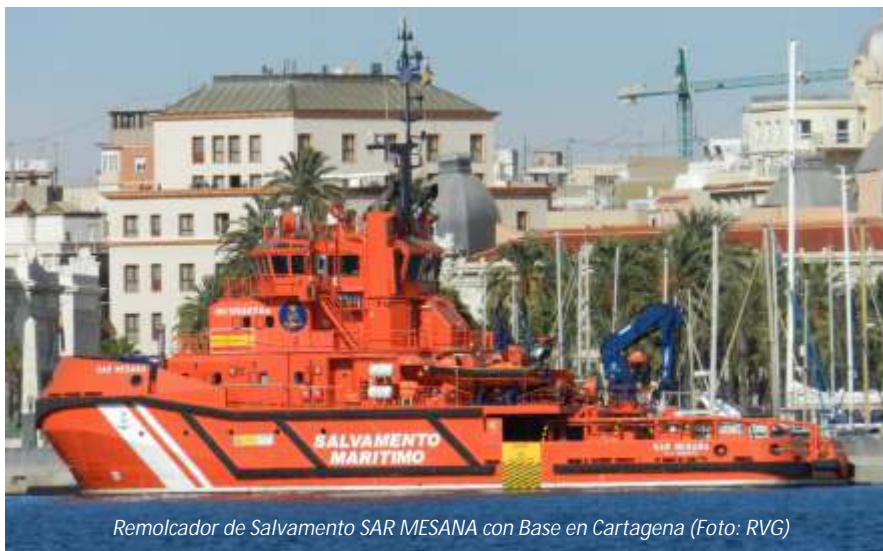
Remolcador de Salvamento SAR MESANA con Base en Cartagena

- Avanzar en la innovación y la investigación, mediante el apoyo y estímulo de áreas o espacios de estudios multidisciplinares, en colaboración con Puertos del Estado y con la participación de otros centros de investigación, universidades y empresas públicas y