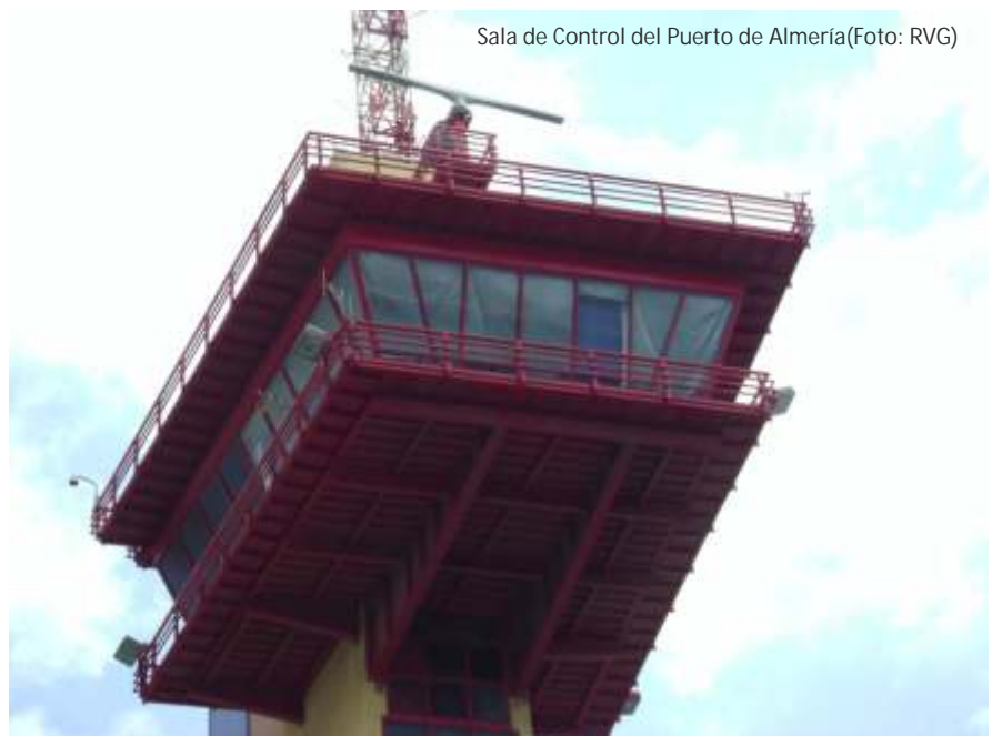
Sala de Control del Puerto de Almería