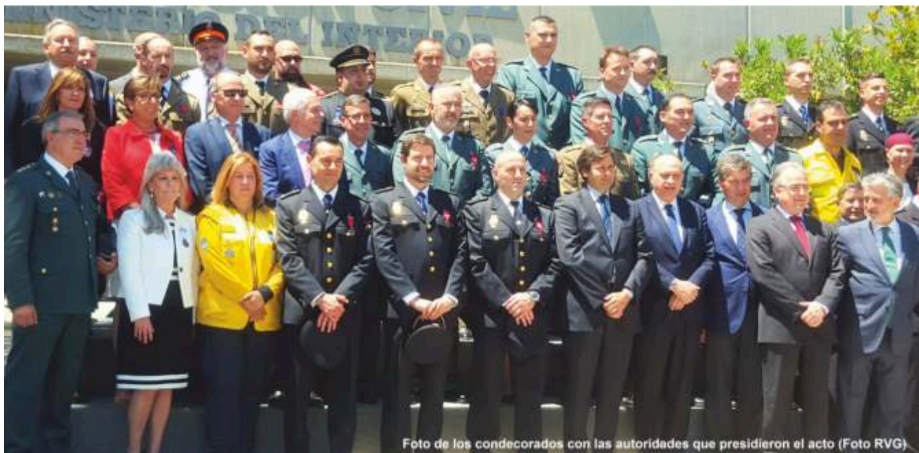
Foto de los condecorados con las autoridades que presidieron el acto (Foto RVG).