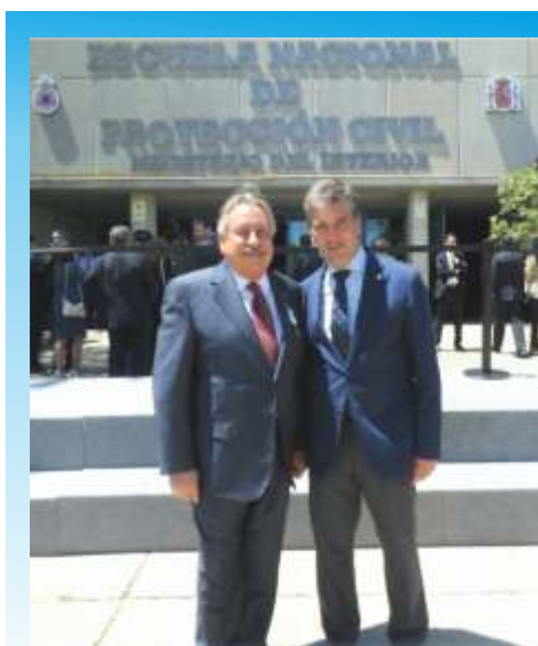
El Editor de la Revista de Emergencias y Seguridad Ciudadana condecorado en este evento junto al Director General de la Policía.

Resaltando también en su discurso la importancia de la Protección Civil en el contexto de la Seguridad Nacional: "La realidad del actual panorama competencial de las administraciones, la dimensión internacional de la Protección Civil y su imbricación en el contexto superior de la Seguridad Nacional son, sin duda, algunos de los ejes sobre los que pivotará la proyección