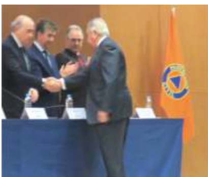
Condecoración al Editor de la Revista Emergencias y Seguridad Ciudadana.

contribución a la difusión de los distintos aspectos del Sistema Nacional de Protección Civil.