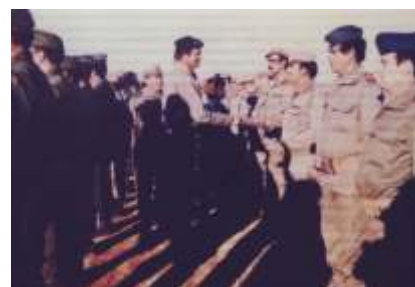
Imagen histórica de 1979. Su Majestad el Rey saludando a componentes del GRUMOCA en el Ejercicio CRISEX (noviembre de 1979).

En el año 1974 se traslada a la Base de 'El Coperó', próxima a Tablada, donde regresa en 1976 y permanece hasta la fecha. Se recepciona el primer radar táctico AN/TPS 43 CX, que permite a la Unidad desarrollar misiones de Defensa Aérea. Este sistema estuvo operativo hasta el año 1983, fecha en que fue sustituido por el Radar AN/TPS-43E.