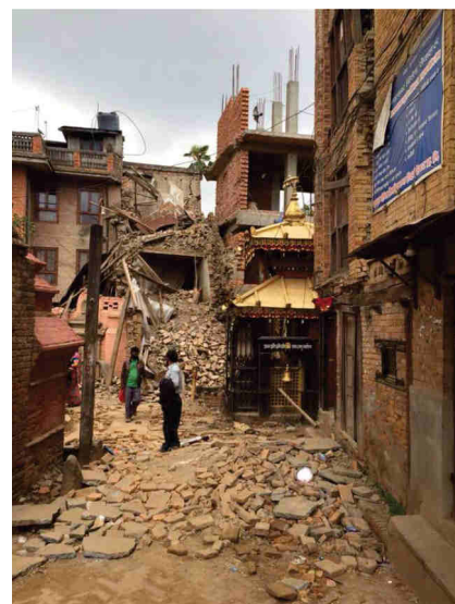
ha desplazado a Katmandú para organizar la evacuación de los españoles afectados.

Posteriormente ha tenido lugar otro terremoto de magnitud 7,3 MW que se registró a las 7:05 GMT (12:50 hora local) del 12 de mayo de 2015, que afectó tanto a Nepal como a los vecinos Bangladés e India. Su hipocentro fue localizado a 15 km de profundidad y su epicentro se ubicó a 18 km al sureste de Kodari, Nepal, el cual ha provocado un centenar de víctimas mortales.