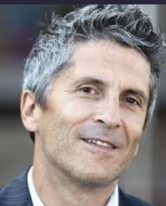
D. FERNANDO GRANDE-MARLASKA Presidente de la Sala de lo Penal de la Audiencia Nacional. Vocal del CGPJ.

17'30 h. CONFERENCIA DE CLAUSURA: "La Audiencia Nacional y la justicia universal"