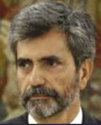
D. CARLOS LESMES SERRANO Presidente del Tribunal Supremo y del Consejo General del Poder Judicial.

17'00 h. CONFERENCIA INAUGURAL: "La organización de los tribunales en el proyecto de nueva Ley Orgánica del Poder Judicial"